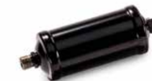
MAN Original Trockenpatronen ab: XXX €