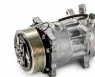
MAN Original Kältekompressoren ab: XXX €