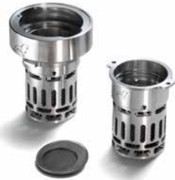
MAN Original Teile für Kraftstofftank-Schutzvorrichtungen ab: XXX €