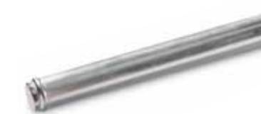
MAN Original Flüssigkeitsbehälter ab: XXX €