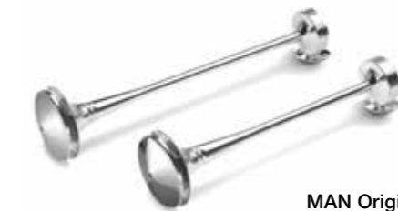
MAN Original Druckluft- und Signalhörner ab: XXX €