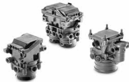
MAN Original Bremsventile ab: XXX €