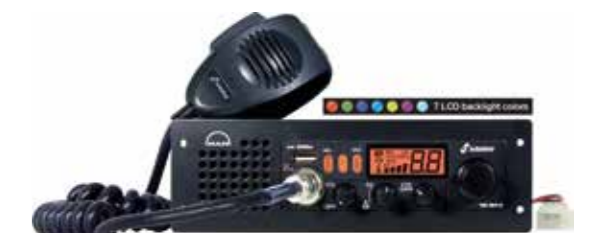
MAN Original CB-Funkgeräte In den Varianten Pro und Basic erhältlich ab: XXX €