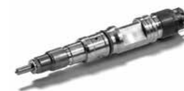
MAN Original Injektoren ab: XXX €