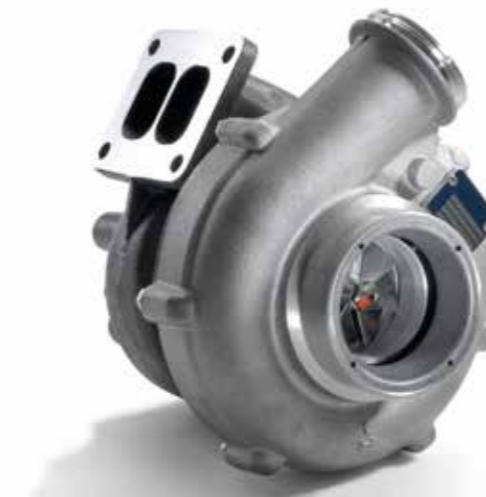
MAN Original Abgasturbolader ecoline ab: XXX €