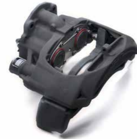
MAN Original Bremsattel ecoline ab: XXX €