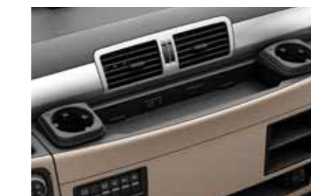
MAN Original Becherhalter ab: XXX €