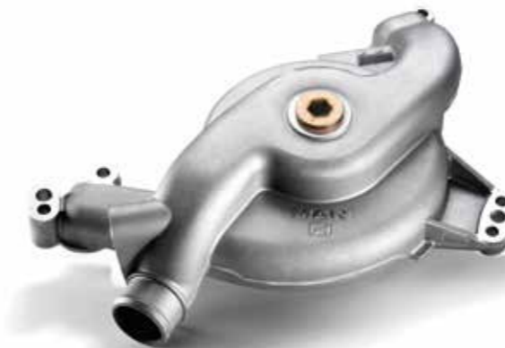
MAN Original Kühlwasserpumpen ab: XXX €