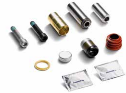
MAN Original Bremsattelreparatursätze ab: XXX €