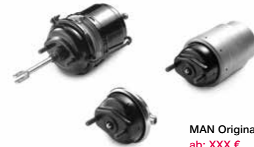
MAN Original Bremszylinder ab: XXX €