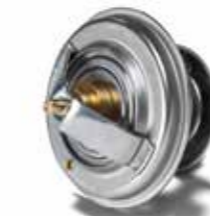
MAN Original Thermostate ab: XXX €