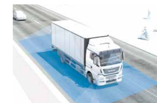
MAN Original BirdView 360°-Kamerasysteme ab: XXX €