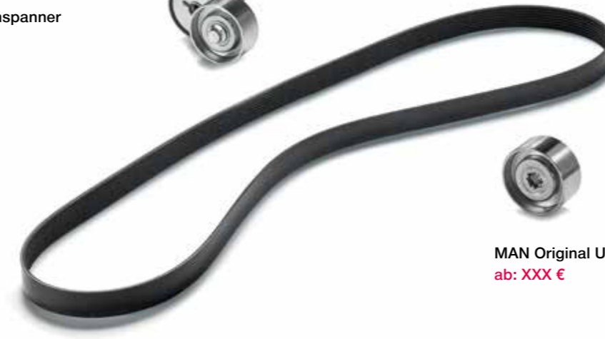
MAN Original Riemen ab: XXX €