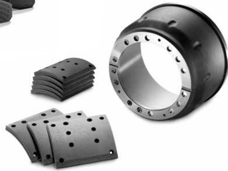
MAN Original Trommelbremsbeläge ab: XXX €