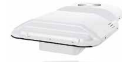
MAN Original Dachklimaanlagen Cooltronic ab: XXX €