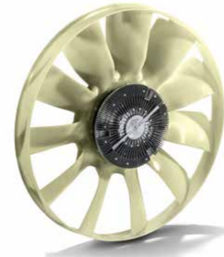
MAN Original Motorlüfter ab: XXX €