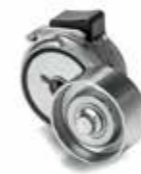
MAN Original Riemen spanner ab: XXX €