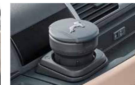
MAN Original Aschenbecher ab: XXX €