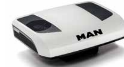
MAN Original Dachklimaanlagen Als RTX2000 und mit noch höherer Kühlleistung als RTX1000 verfügbar. ab: XXX €

Mit den MAN Original Standklimaanlagen können Sie Ihre Ruhezeiten erholsam im Fahrerhaus verbringen, ohne stundenlang den Motor laufen zu lassen und große Mengen an Kraftstoff zu verbrauchen. Gut ausgeruht fahren Sie sicherer. Durch ihre hocheffiziente Technik kühlen die Anlagen schnell und zuverlässig bis zu 12 Stunden, und das bei niedrigen Betriebskosten.