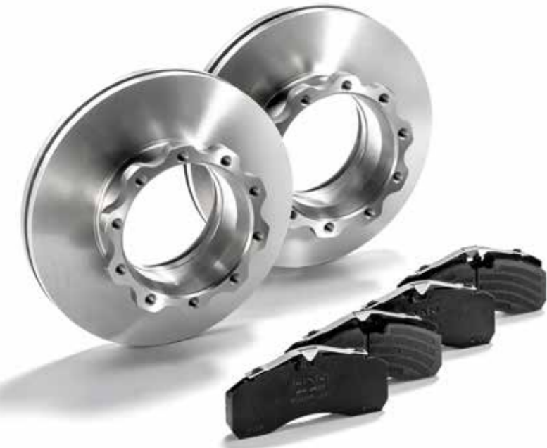
MAN Original Bremsscheiben ab: XXX €