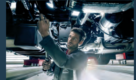
Kompletter Service für das gesamte Fahrzeug.

Unsere mehr als 150 MAN ServiceComplete Standorte sind so dicht über ganz Deutschland verteilt, dass Sie ganz sicher einen kompetenten Partner in Ihrer Nähe finden.