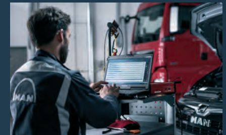
Höchste Qualitätsstandards, Originalteile und erfahrenes Fachpersonal.